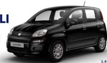
FIAT PANDA 1.0 FIREFLY S&S HYBRID

OPPURE DUE ANNI DI GARANZIA INCLUSI NEL PREZZO